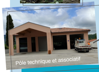
Pôle technique et associatif