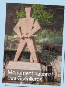
Monument national des Guérilleros