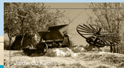
Jardin du Kaolin