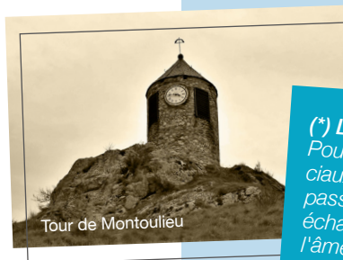
Tour de Montoulieu