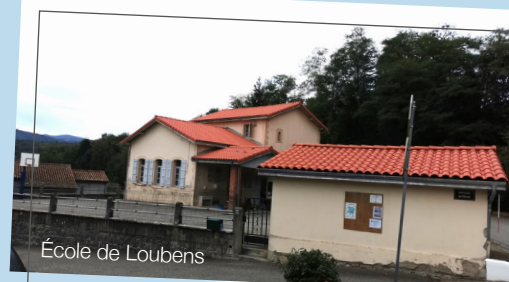
École de Loubens