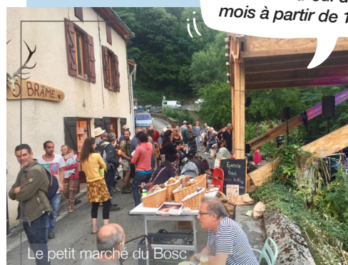
Le petit marché du Bosc

Le petit marché Rendez-vous de mai à octobre, le 2 e vendredi du mois à partir de 18h