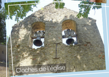
Cloches de l'église